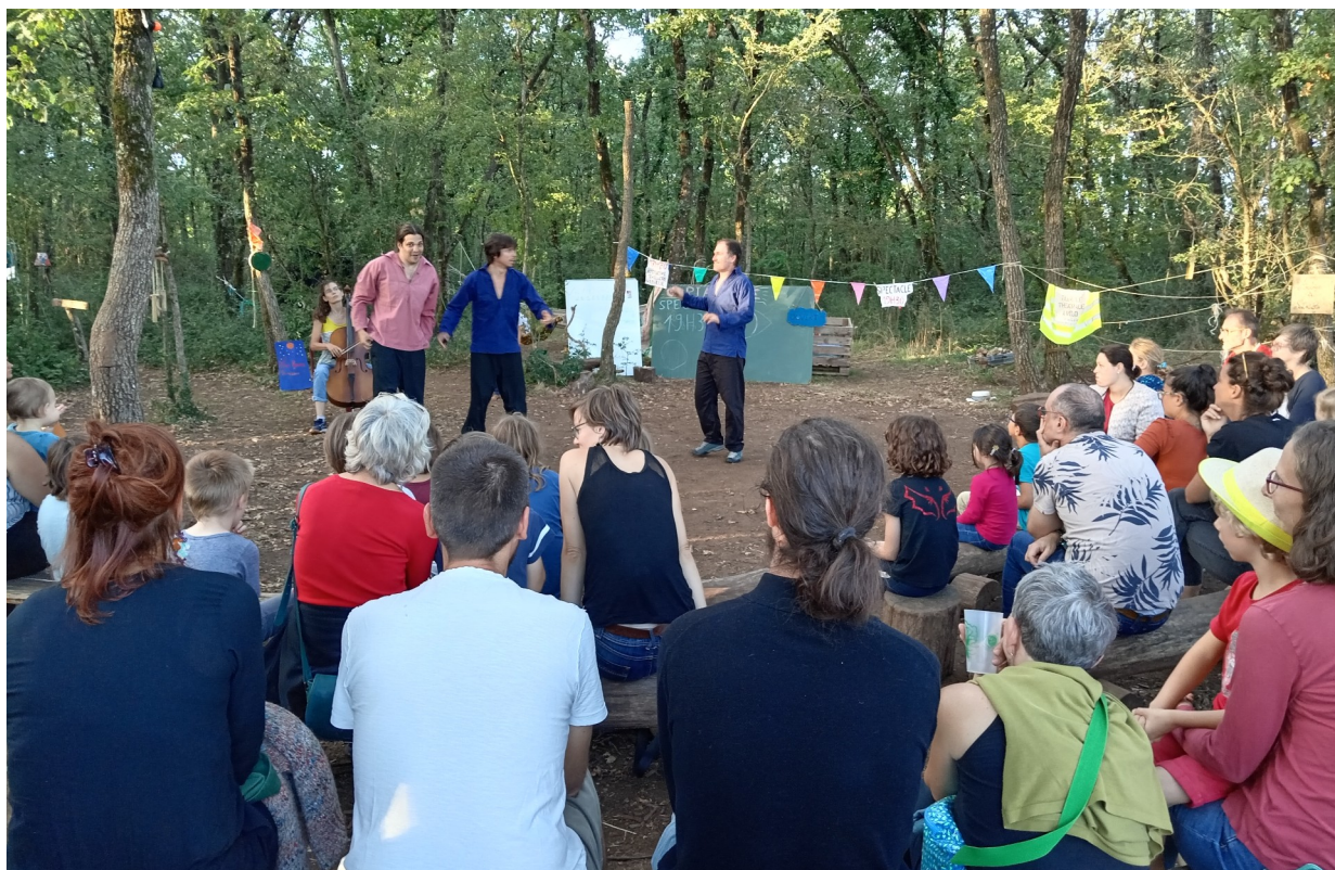
A Lussault-sur-Loire, août 23

Le Manuscrit des chiens III : Quelle misère ! de Jon Fosse, traduction de Terje Sinding, est publié et représenté par L'ARCHE – éditeur et agence théâtrale. www.arche-editeur.com