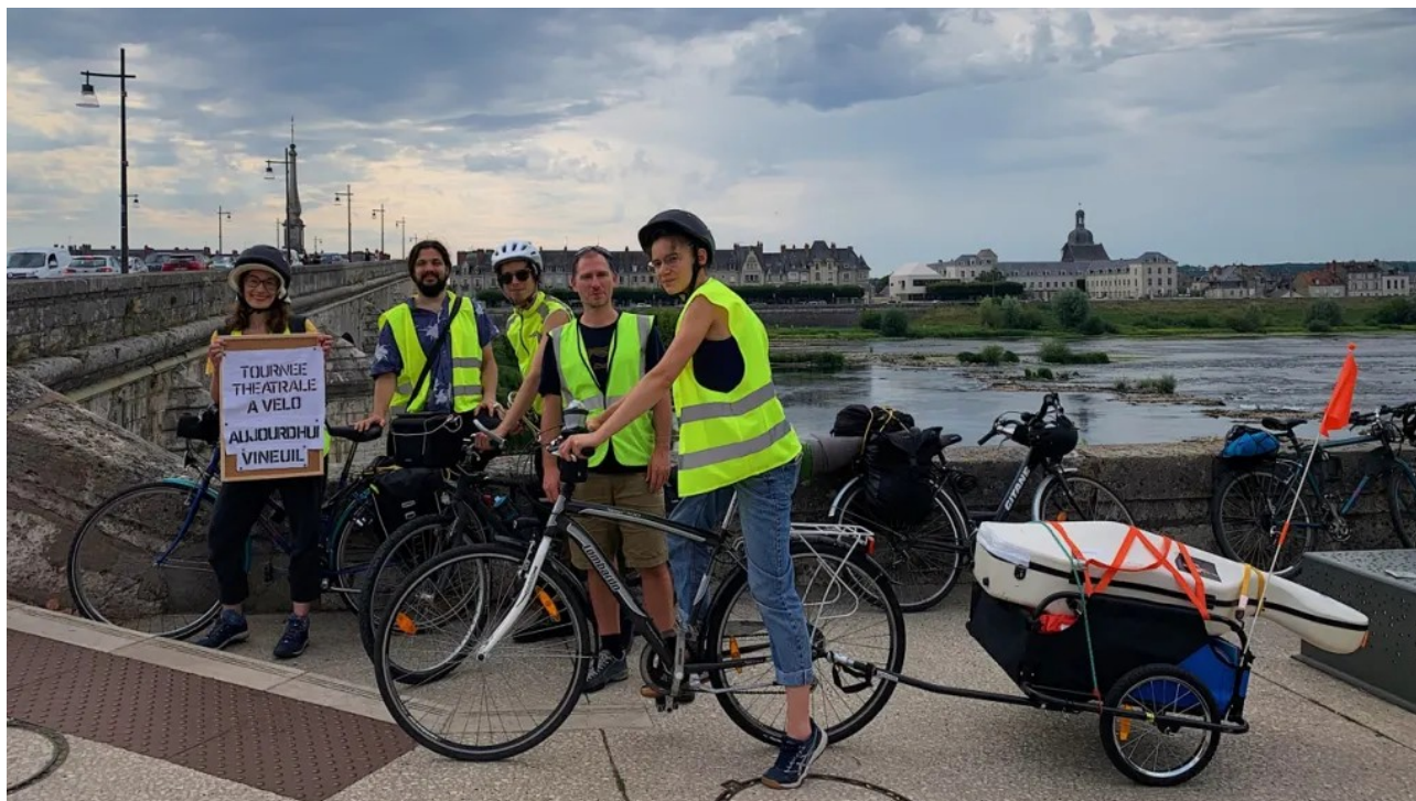
Départ à Blois, août 23