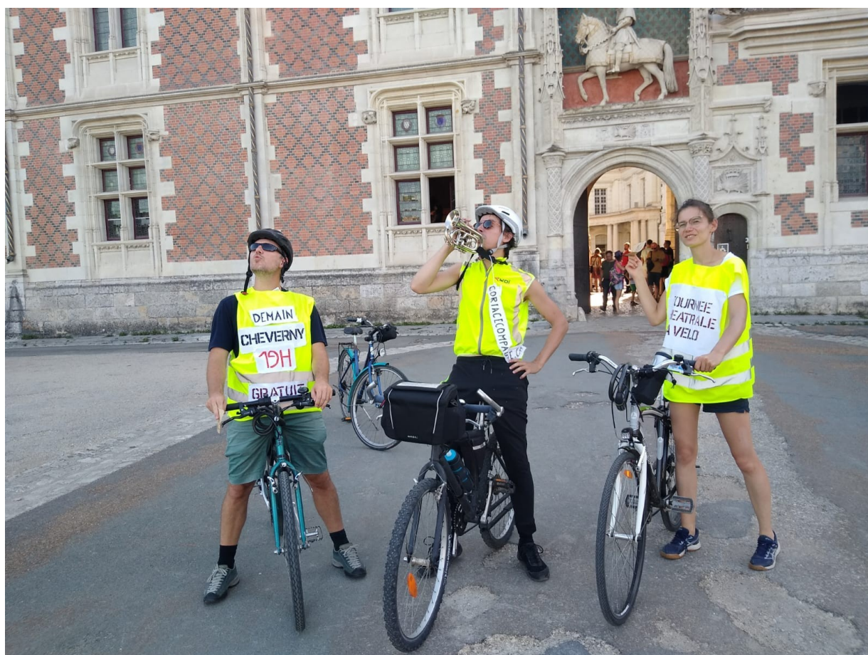
Parade à Blois, août 23