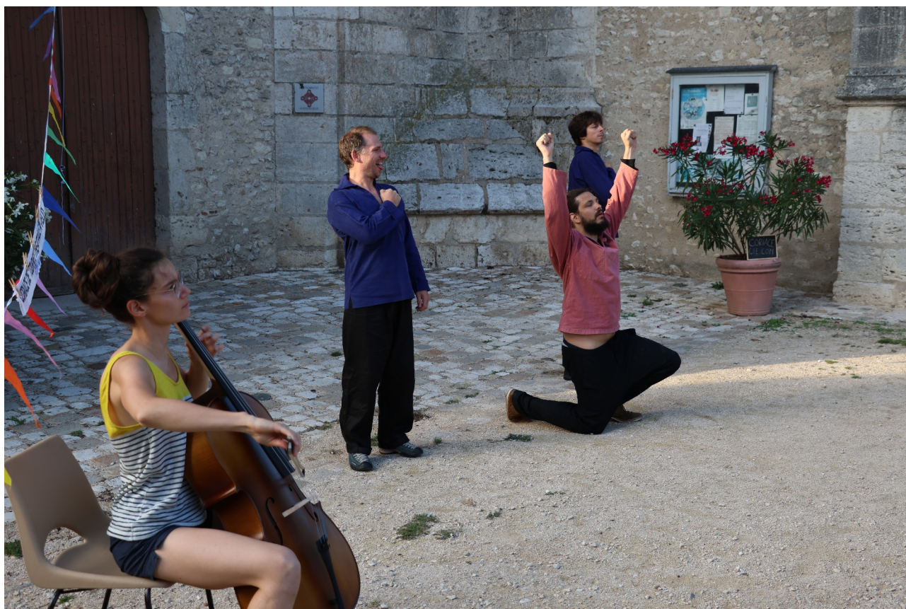
A Saint-Dyé-sur-Loire, août 23