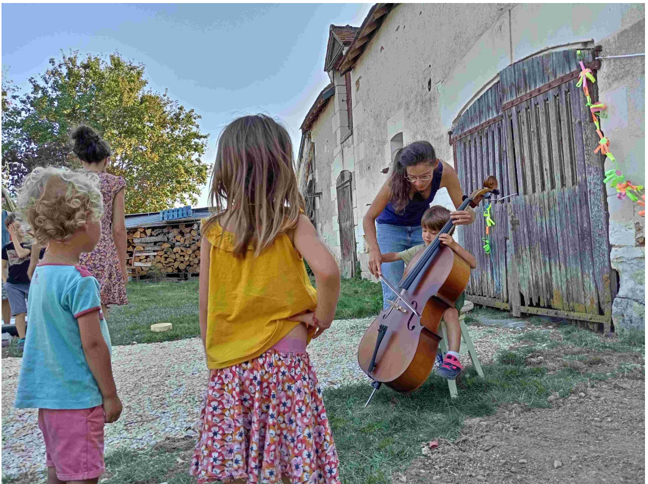
En haut : à Tours, août 23 – En bas : atelier musique à Betz-le-Château, août 23