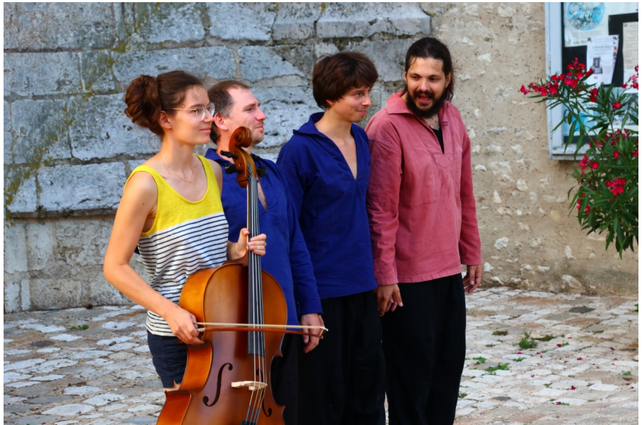
A Saint-Dyé-sur-Loire, août 23

Associer écologie et démocratisation culturelle , en choisissant le transport train+vélo, pour présenter Le Manuscrit des chiens III de Jon Fosse. Le spectacle est jouable en salle équipée ou en autonomie en plein air. Le matériel (instrument de musique, costumes) est tracté à vélo.